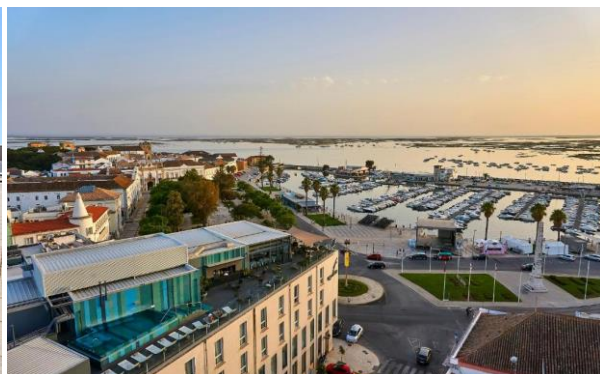
Vasen kuva: Hotel A Esteva **, Castro Verde , oikea kuva: Hotel Occidental ***, Faro .