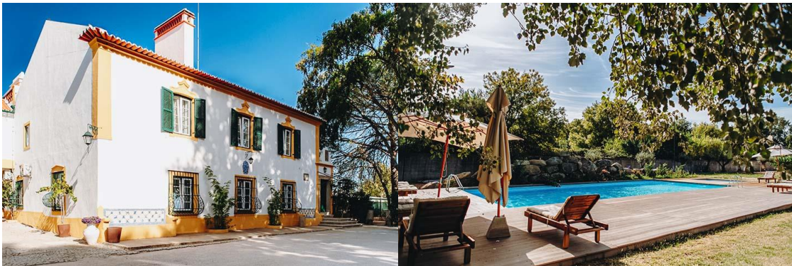
Quinta do Louredon kartano Évorassa on matkan ensimmäinen majapaikkamme.

Yöpyminen Quinta do Louredon kartanolla Évorassa.