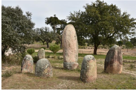
Montemor-o-Velhon linna & Cromeleque das Fontainhasin megalittinen kivikehä (Mora)