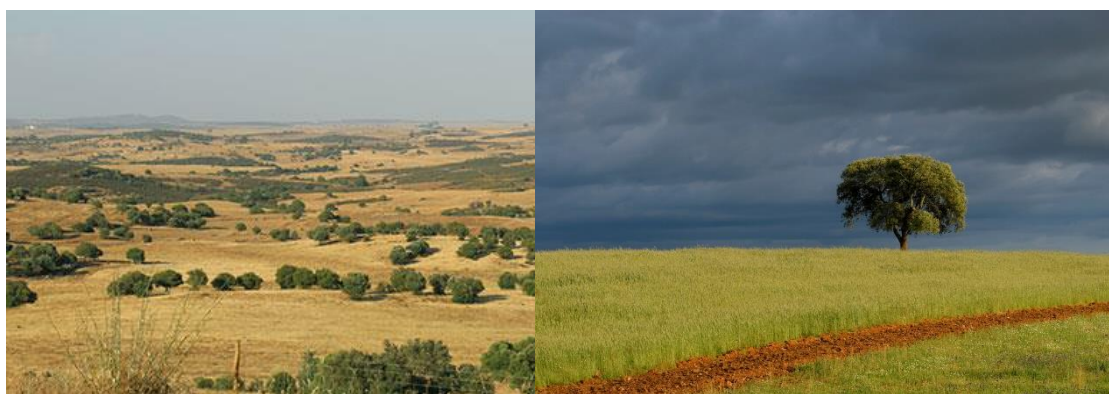
Baixo Alentejon eli eteläisen Alentejon maakunnan avarat maisemat odottavat Sinua...

MATKAVAKUUTUS: Suosittelemme peruutusturvan sisältävän matkavakuutuksen hankkimista ja EU-sairaanhoitokortin mukaan ottamista (tämän erittäin hyödyllisen kortin myöntää Kela ja se on maksuton).