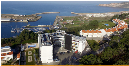
Hotel Miramar Sul **** (Nazaré)