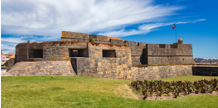
Porto: Forte de São João Baptista da Fozin linnoitus 1500-luvulta