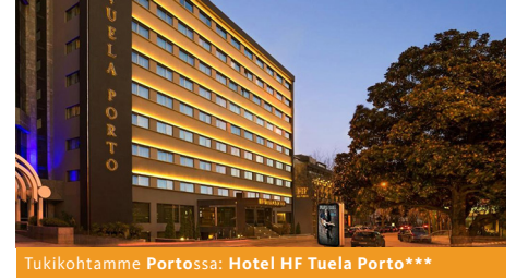
Tukikohtamme Portossa: Hotel HF Tuela Porto***

Suosittellemme peruutusturvan sisältävän matkavakuutuksen hankkimista ja EU-sairaanhoitokortin mukaan ottamista (tämän erittäin hyödyllisen kortin myöntää Kela ja se on maksuton).