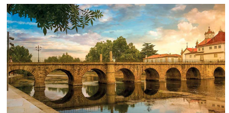
Romaanin keisari Trajanuksen mukaan nimetty silta Chavesissa