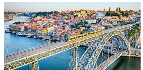
Porto, Douro-joki ja vuonna 1886 valmistunut rautasilta Ponte Dom Luís I