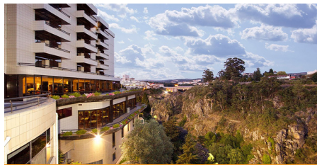
Hotel Mira Corgo **** (Vila Real)