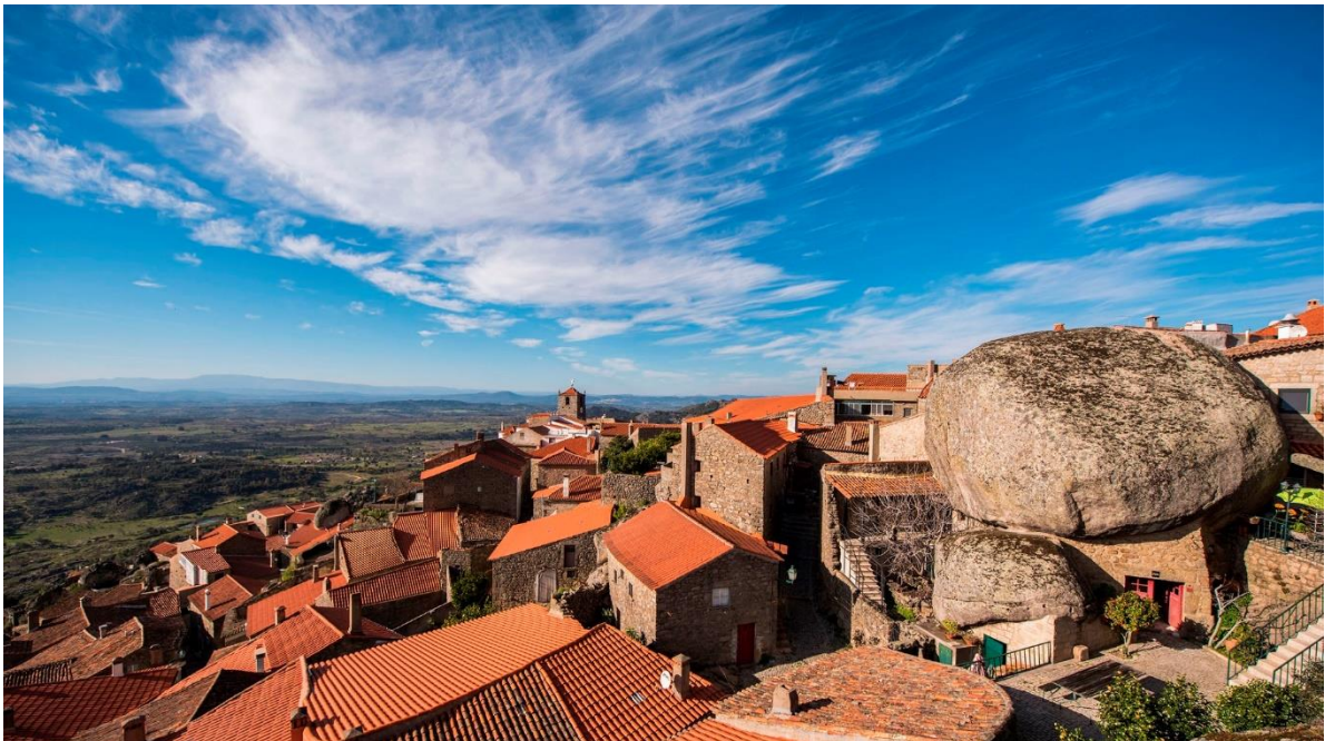
Monsanto – "Portugalin portugalilaisin kylä" – tervetuloa lumoutumaan kivistä kiviläiskien keskelle!

23.15 Lento saapuu Helsinki-Vantaan lentoasemalle.