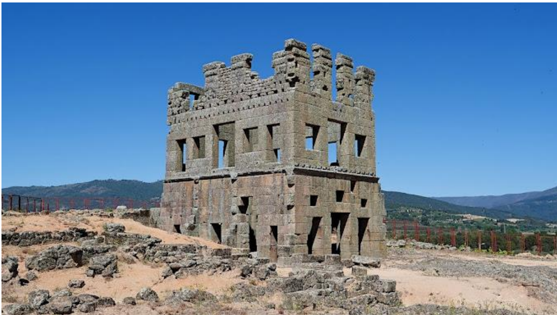
Centum Cellasin mystinen roomalainen torni odottaa meitä Belmonten liepeillä...