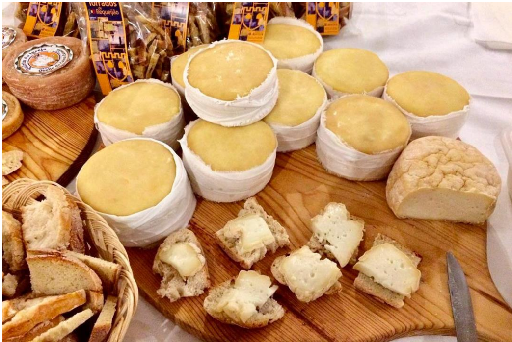
Serra da Estrelan vuoristo tunnetaan juustoistaan, joita myös maistelemme matkalla.

MATKAVAKUUTUS: Suosittelemme peruutusturvan sisältävän matkavakuutuksen hankkimista ja EU-sairaanhoitokortin mukaan ottamista (tämän erittäin hyödyllisen kortin myöntää Kela ja se on maksuton).