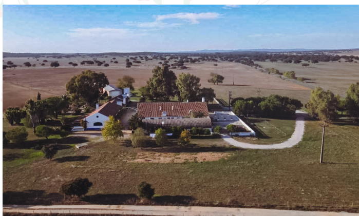
Monte do Sobralin perinteisellä alentejolaisella maatilalla pidettiin 136 vallankumouksellisen upseerin ensimmäinen salainen kokous 9.9.1973.