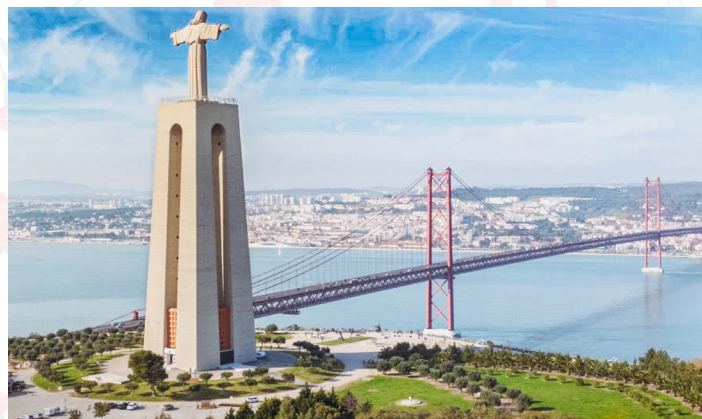
Lissabon: Largo do Carmo 25.4.1974, Almada: Kristus-patsas ja Ponte 25 de Abrilin silta.