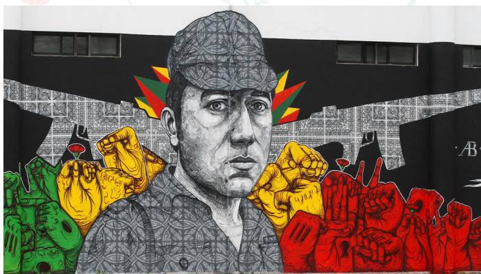
Lissabon: Praça do Comércio aukio & seinämaalaus kapinakapteeni Salgueiro Maiasta.

MATKAN HINTA lentoineen, retkineen, kuljetuksineen, puolihoitolla (paitsi 21.4. ja 26.4.) ja hotellimajoituksella jaetussa 2 hengen huoneessa: 1738,00 €/hlö. Vaihtoehto ilman